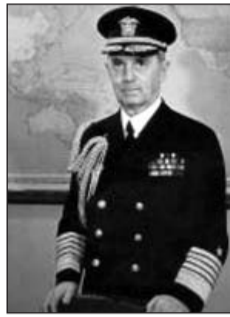
William D. Leahy

Követve George C. Marshall tábornok 1941-es elgondolását, miszerint japán vá-