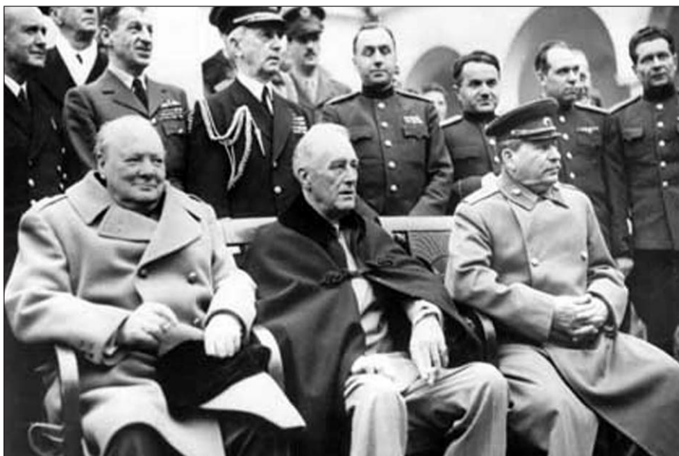
A három fő háborús bűnös Jaltában

„Tartsuk Japánt háborúban további három hónapig és bevethetjük a bombát a városaikra. A háborút úgy fogjuk befejezni, hogy a világ, összes népe rettegni fog tőlünk és engedelmessé fog az akaratunknak.”