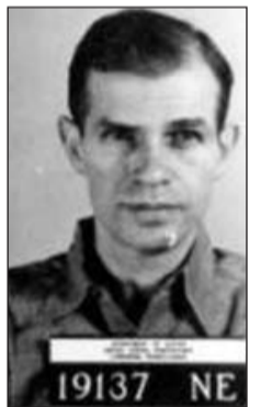
Alger Hiss, akit elítéltek, mint kommunista és szovjet kém

nyerünk semmit sem.” – mondta Stettinius. „Akkor őket háborúban kell tartani, amíg a bomba elkészül” – indítványozta Dulles. „Ez nem probléma. Feltétel nélküli megadás.” „Ezt nem fogják elfogadni. Megesküdtek, hogy megvédik a császárt” – jegyezte meg Stettinius. „Pontosan” – mondta Dulles.