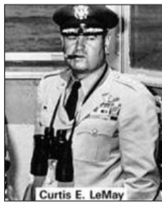
Curtis E. LeMay

1945. májusában a Japánra ledobott bombák 75%-a gyújtóbomba volt. A Time magazin kedvelői ennek folytatására éreznek kedvet, akik kifejtik, hogy „megfelelően lánggra lobbantva a japán városok úgy fognak elégni, mint az őszi legyek”. – Le May hadjárata mintegy 672 000 japán életét vette el. Az amerikaiak teljesen figyelmen kívül hagyták a császár jelentőségét, akit a japánok is tenként tisztelnek.