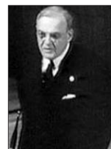
John Foster Dulles

nyerünk semmit sem.” – mondta Stettinius. „Akkor őket háborúban kell tartani, amíg a bomba elkészül” – indítványozta Dulles. „Ez nem probléma. Feltétel nélküli megadás.” „Ezt nem fogják elfogadni. Megesküdtek, hogy megvédik a császárt” – jegyezte meg Stettinius. „Pontosan” – mondta Dulles.