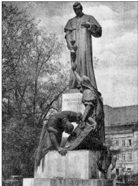
Prohászka szobra Budapesten

Az evangélium nemzetgazdasági elve: az Isten-fiúság s a Krisztus-testvérség! Sajnos, hogy ezt az elvet sohasem vitték véghez, sohasem fejlődött jogrendszerre, sehol sem épített föl társadalmi épületet: az egész az – írta a Napba öltözött forradalmár – amit véghez vitt, hogy egyes buzgó lelkek a jótékonyágban s az alimizsnában akarták kipótolni a jognak fogyatékoságát.”