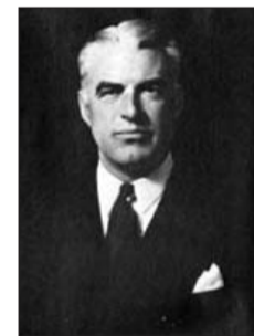
Ifjabb Edward Stettinius külügyminiszter

„De Külügyminiszter Úr, senki sem hagyhatja figyelmen kívül ennek a fegyvernek iszonyatos erejét” – jegyezte meg Alger Hiss. „Mindazonáltal” – válaszolta Stettinius – „a mi egész háború utáni programunk függ attól, hogy rettegésben tartjuk a világot az atombombával”. „A cél elérésére egy hatalmas tételre van szükségük. Mondjuk 1 milliós tételre” – fűzte hozzá John Foster Dulles. „Igen, mi egy milliós tételt remélünk Japánban. De ha ők leteszik a fegyvert, mi nem