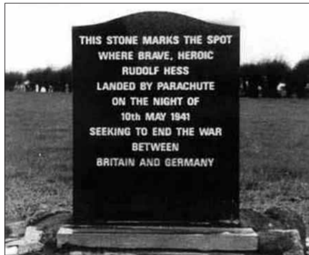
Emlékmű Skóciában azon a helyen ahol, Hess ejtőernyővel földet ért 1941 május 10-én

5. A békekötés után 2 éven belül Németország csatlós államokat hoz létre Lengyelországban, Dániában,