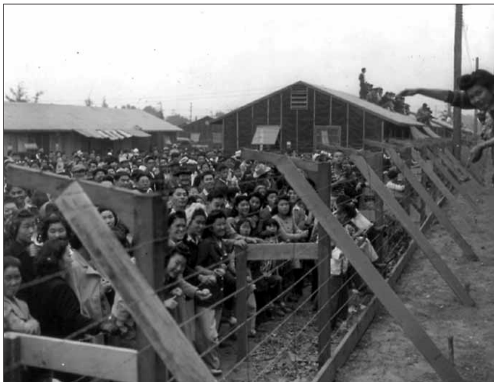
Santa Anita-i japán internáló tábor Kaliforniában

Minden bemenő és kimenő levelet cenzúráztak. Minden belső kommunikációt szigorúan ellenőriztek. A japán vallás gyakorlását, nyilvános összejöveteleken pedig még a japán nyelv használatát is betiltották.