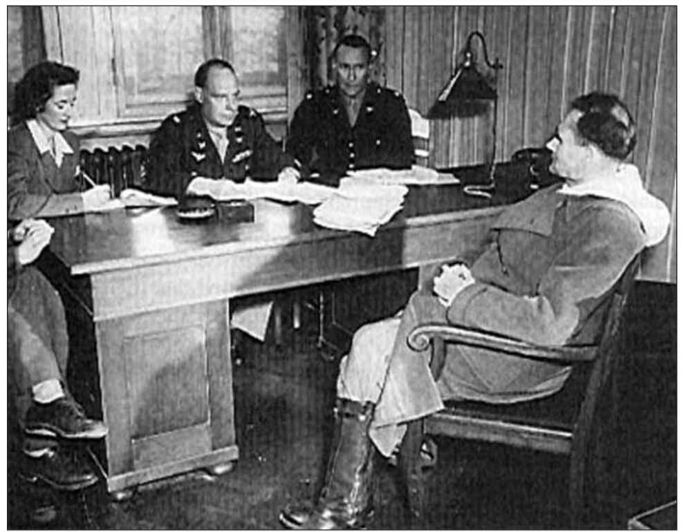
Rudolf Hess kihallgatása Nagy-Britanniába érkezése után

9. Hess Skóciába repülésének terve a francia hadjárat utolsó napjaiban öltött formát, és Hess bátorította az a felfedezése, hogy Anglia folytatta béketafogatózását Svájcban és Spanyolországon keresztül.