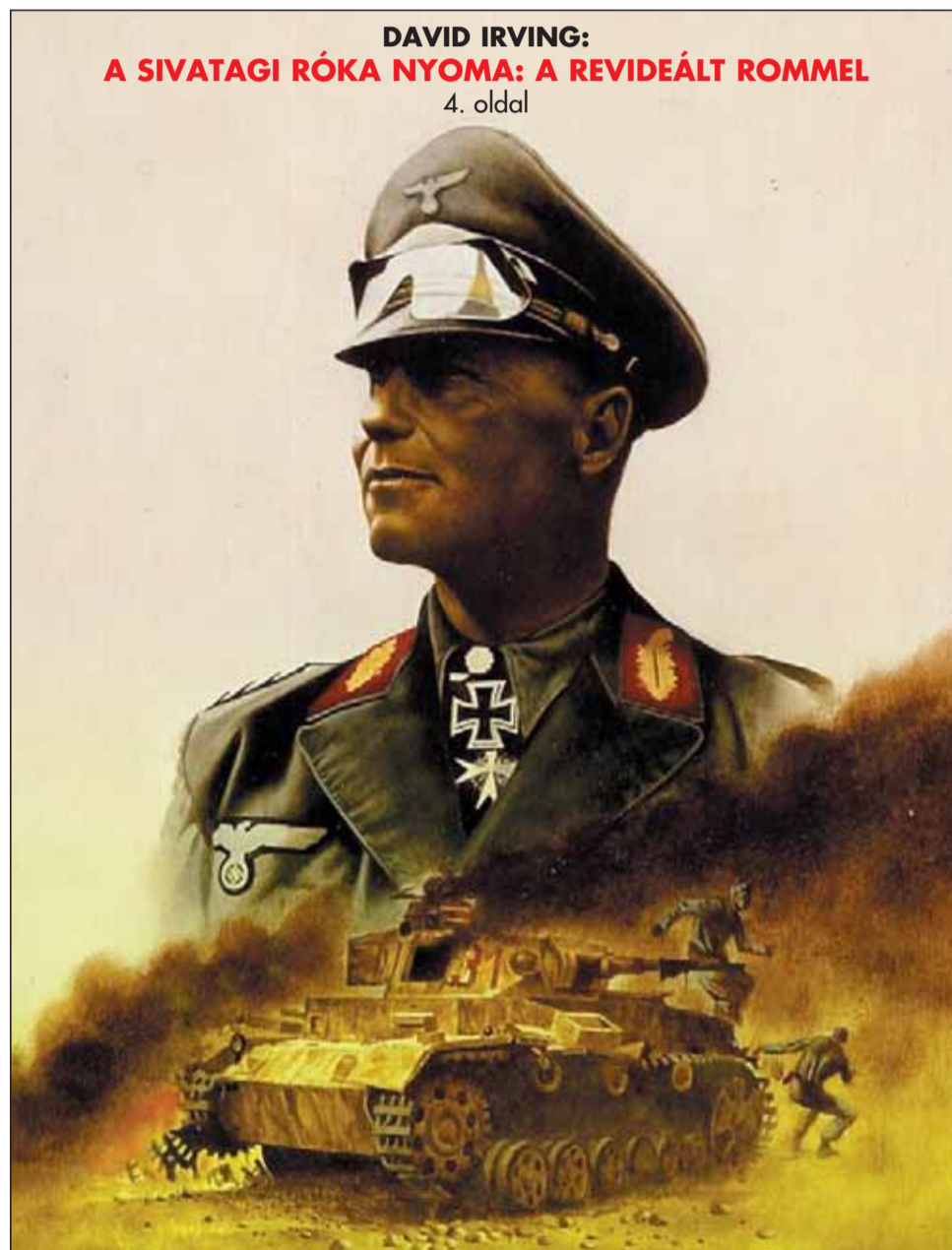
DAVID IRVING: A SIVATAGI RÓKA NYOMA: A REVIDEÁLT ROMMEL 4. oldal

Szent István kereszténysége, amely korának legiszultabb és legemelkedettebb kereszténysége volt, az ő európaiságáról szól, amely nem az egyik vagy másik szomszédhoz való szellemi vagy politikai alkalmazkodásban jelentkezett – mint ahogyan újabban jóhiszemű kontárok és rosszhiszemű